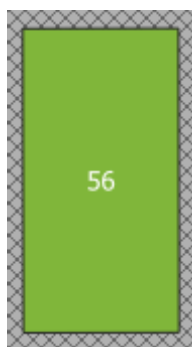
Obr. 2 Ukázka zobrazení volných hrobových míst na mapě hřbitova